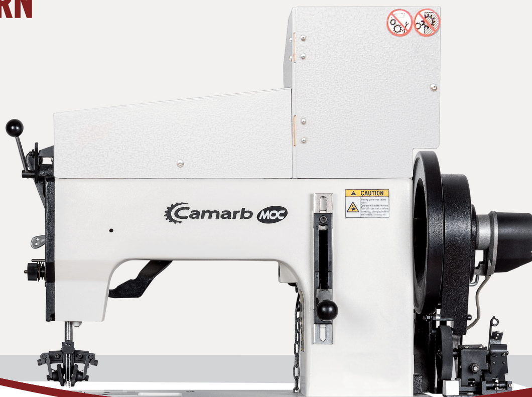
Tipi di cucitura Sewing types